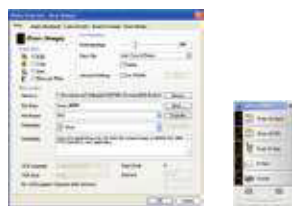
Pantalla principal de Button Manager V2

Completa su escaneo con un paso sencillo