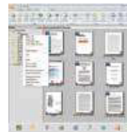
Pantalla principal de PaperPort SE14

- La elección profesional para organizar y compartir sus documentos