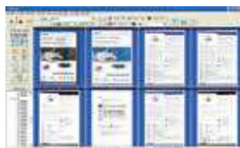
Pantalla principal de AVScan X

Herramienta de gestión inteligente de documentos